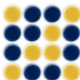
ELISA CLIA kity